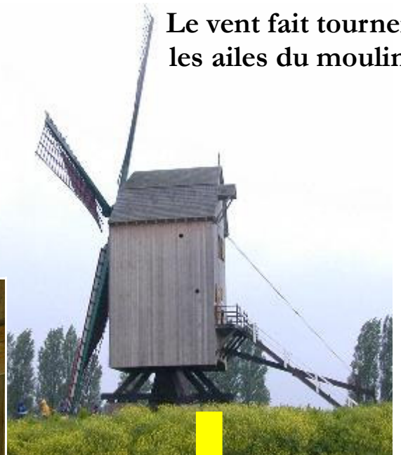
Le vent fait tourner les ailes du moulin