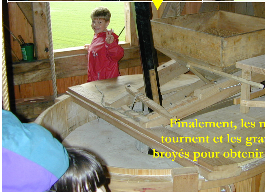
Finalement, les meules tournent et les grains sont broyés pour obtenir la farine.