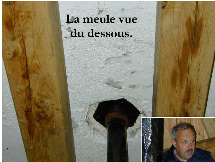
La meule vue du dessous.