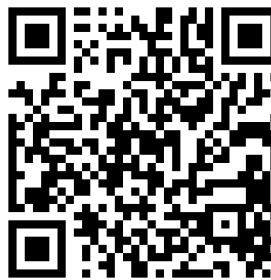
Différencier être vivant et non-vivant