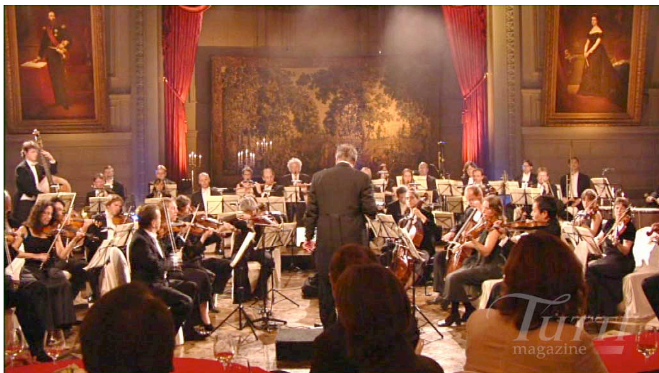
L'ensemble Anima Eterna Brugge